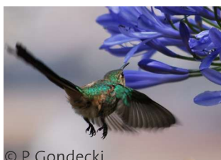
Der Kolibrischnabel ist sehr gut an seine Blüte angepasst.

Nicht jeder Kolibrischnabel sieht gleich aus. Die unterschiedlichen Arten haben auch unterschiedliche Schnäbel.