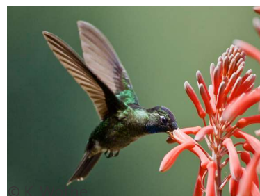
Manche Kolibris sind kleiner als Blüten.